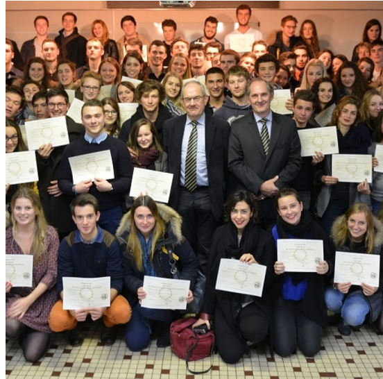
Jour du bac de son fils