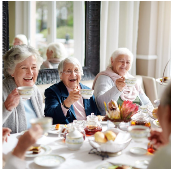
Mémé avec ses amies