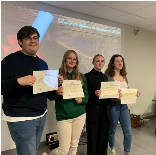
Les cousins avec leurs bacs.