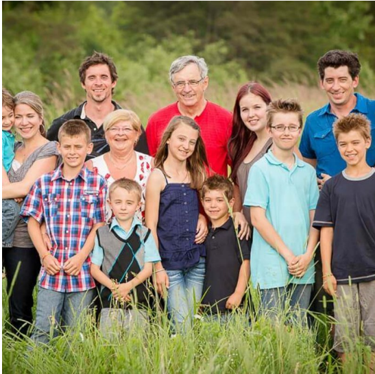
Souvenir de vacances en famille.