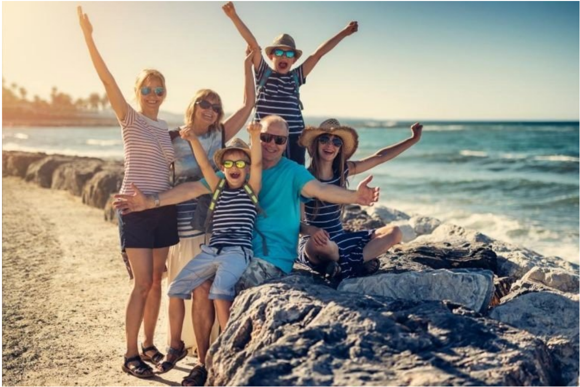
Nos vacances de 2014;