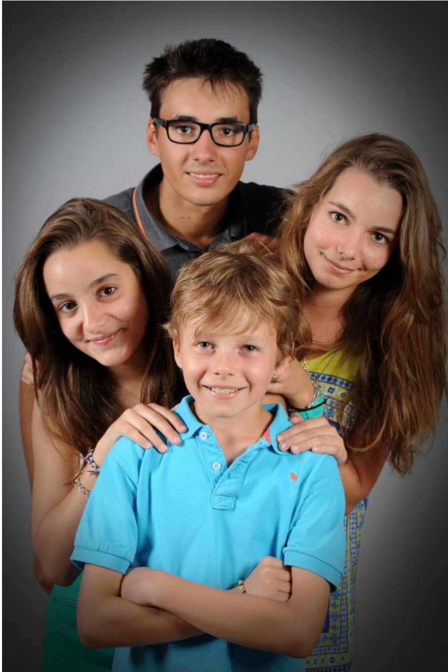
Ses petits enfants aujourd'hui.