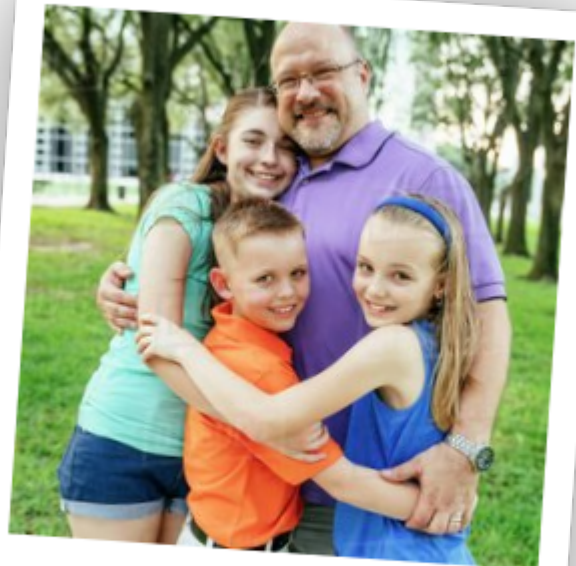
Son fils et ses petits-enfants.