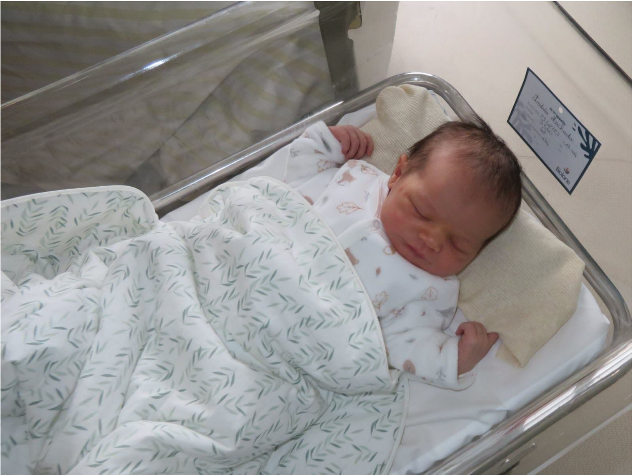
Ton bébé à sa naissance.