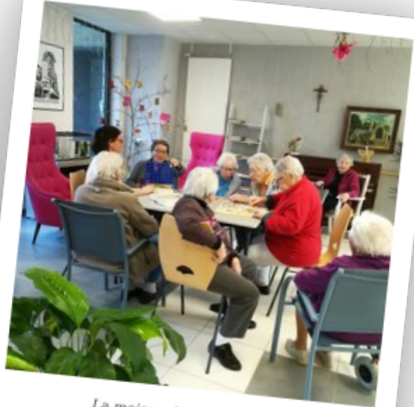
La maison de retraite de sa maman où elle aimait aller.