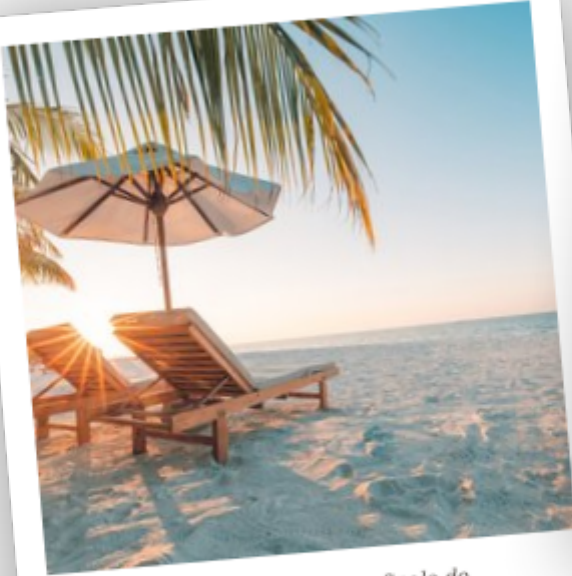
La plage après notre finale de Tennis aux Baléares en 2012