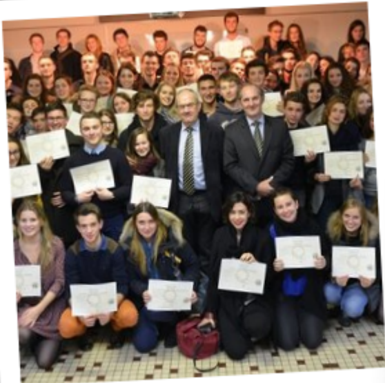
Tes petits enfants ont eu leur bac ensemble.