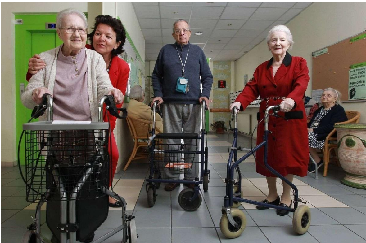
Promenade avec ta grand-mère